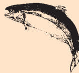
Skotsk Atlanterhavs Laks