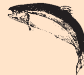
Skotsk Atlanterhavs Laks