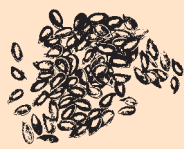
British Grown Linseed